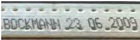
Bilde 2: Bildet av denne avstandslisten viser at vinduet/isolerglasset er produsert 23.6.2009.

Produksjonsåret står som oftest trykket inn i avstandslisten mellom glassene (se bilde 2 nedenfor).