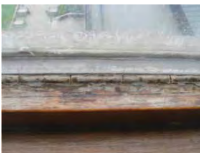
Bilde 1: Vindu med asbestholdig kitt.

Asbestholdig avfall fra næringsvirksomhet skal deklarerer som farlig avfall før avfallet leveres til godkjent mottak. Se www.avfallsdeklarerer.no eller ta kontakt med et avfallsmottak. Emballasjen skal merkes med deklarasjonsskjemaets løpenummer.